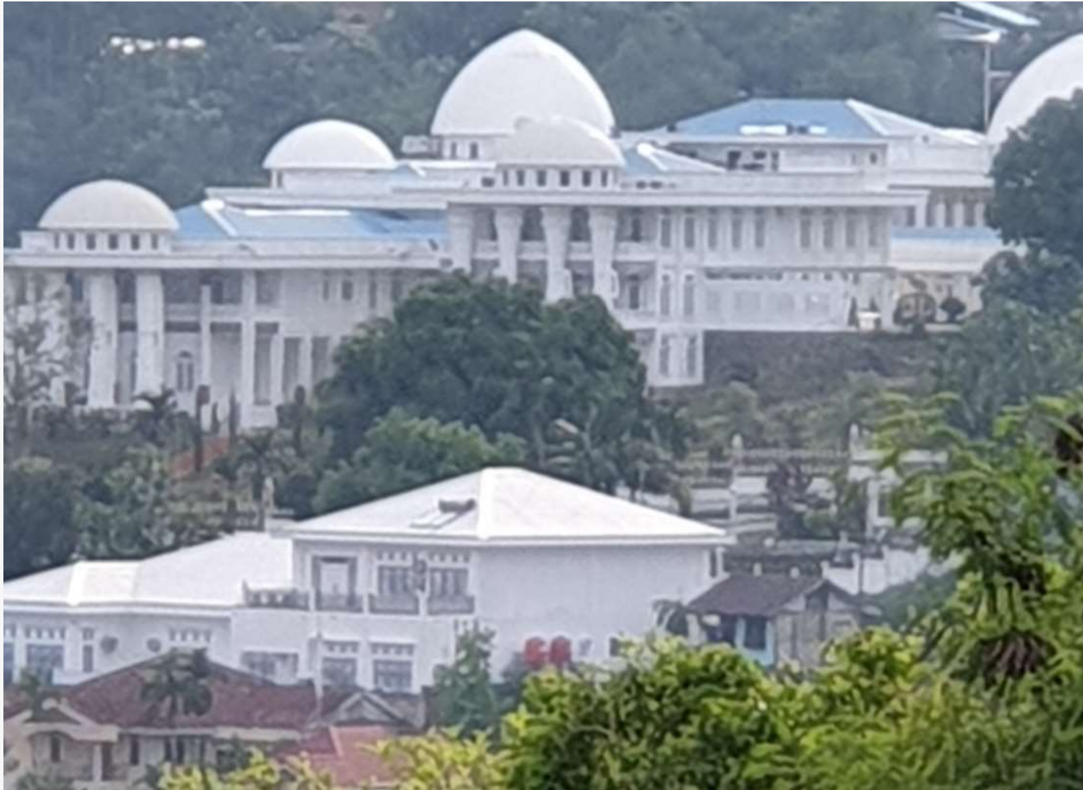
Istana dan Koteka