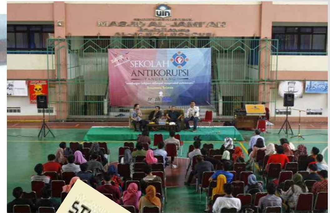
Suasana diskusi dan Integrasi Kelompok Masyarakat Anti Korupsi di Hall SC UIN ... Kamis (16/4).