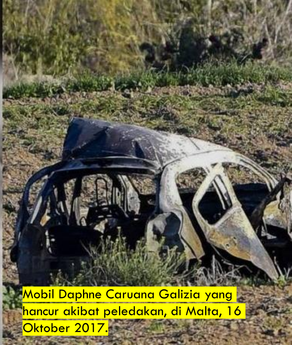
Mobil Daphne Caruana Galizia yang hancur akibat peledakan, di Malta, 16 Oktober 2017.